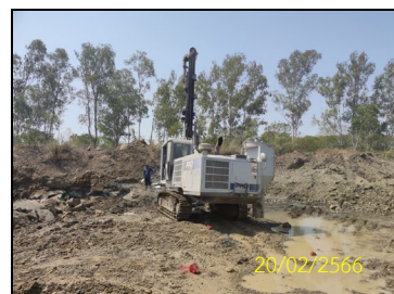
ภาพที่ 1-1 ลักษณะกิจกรรมบริเวณพื้นที่โครงการ